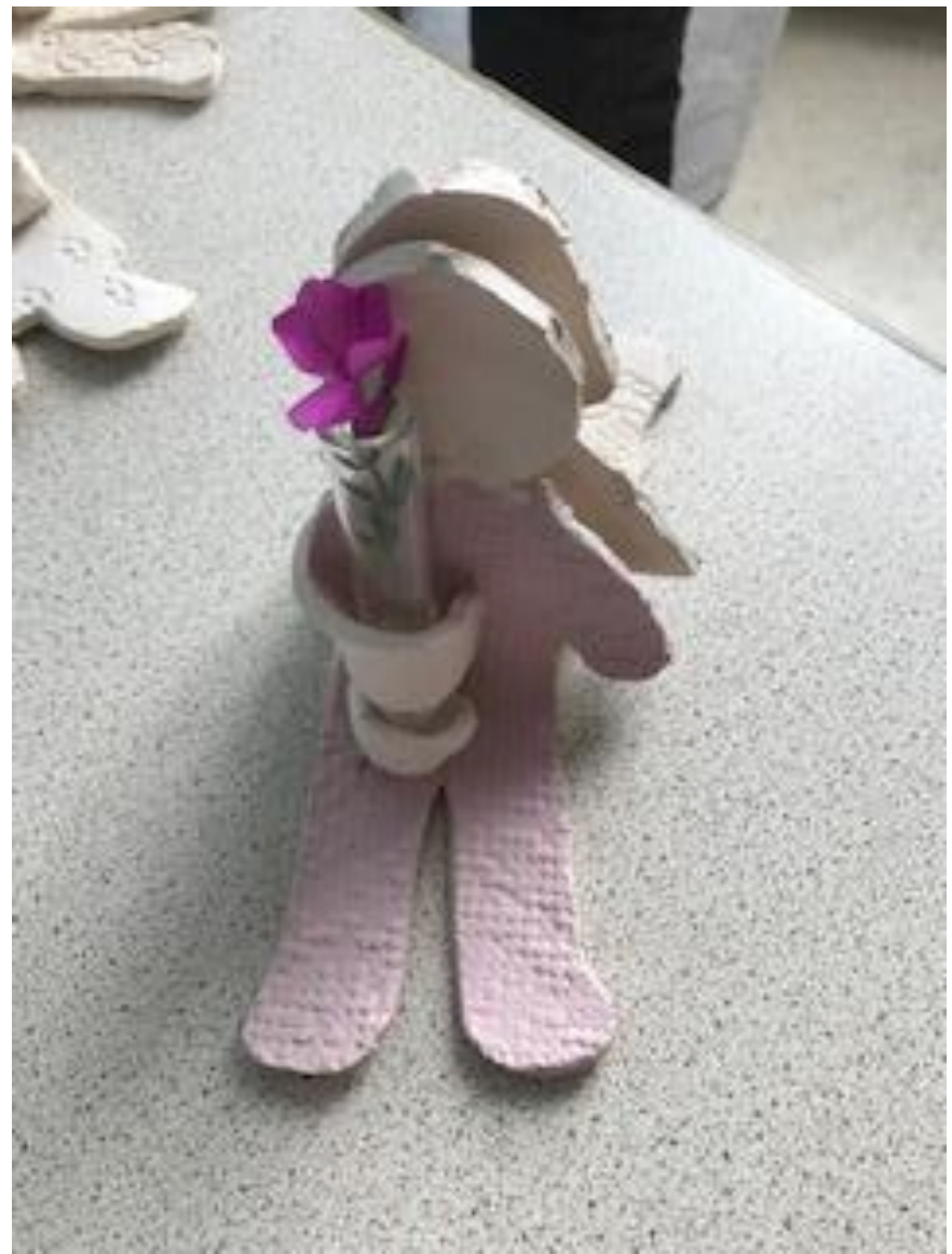
Futur cadeau pour la fête des parents